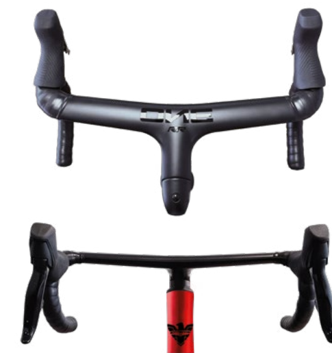
OME RR FULL CARBON INTEGRATED DI SERIE / AS STANDARD

59RD 8AVIO ULTIMATE Shimano Ultegra Di2 24s Disk PESO / WEIGHT 8,740 Kg taglia M / size M COLORE / COLOUR D3 Argento rosso D3 Silver red