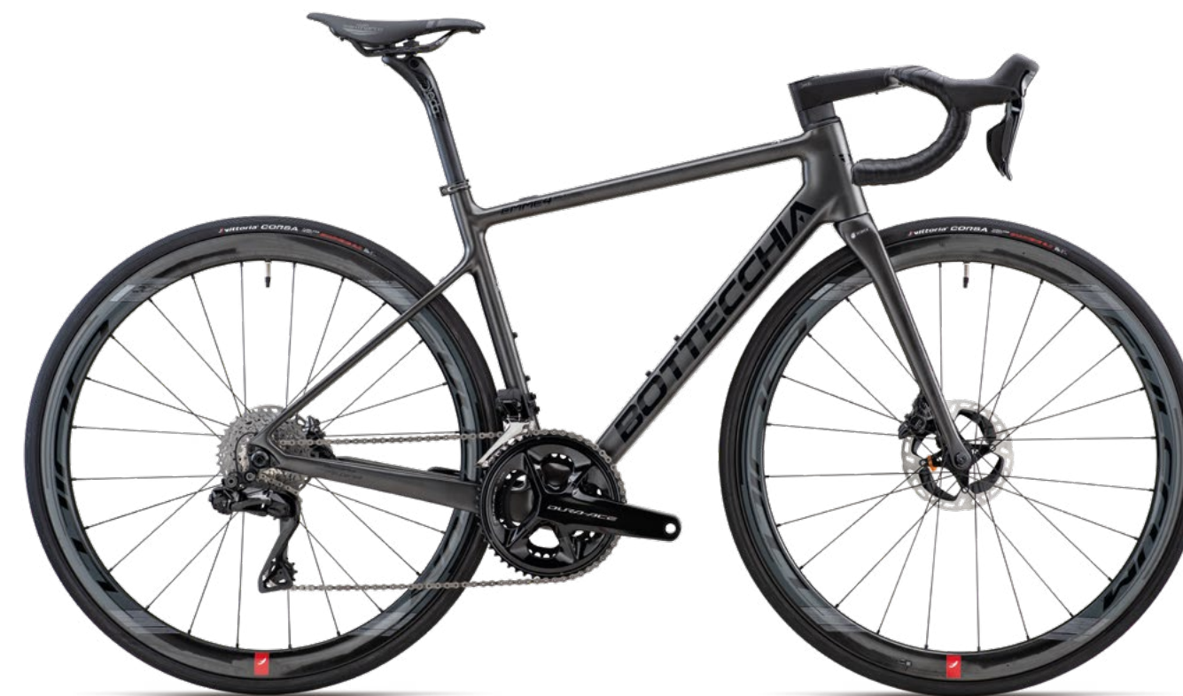
OPZIONE: Piegia integrata Deda Alanera / OPTION: Deda Alanera integrated handlebar

73TD EMME 4 SLI Shimano Dura Ace Di2 24s DISK PESO / WEIGHT 7,270Kg taglia M / size M COLORE / COLOUR 86 Grafite