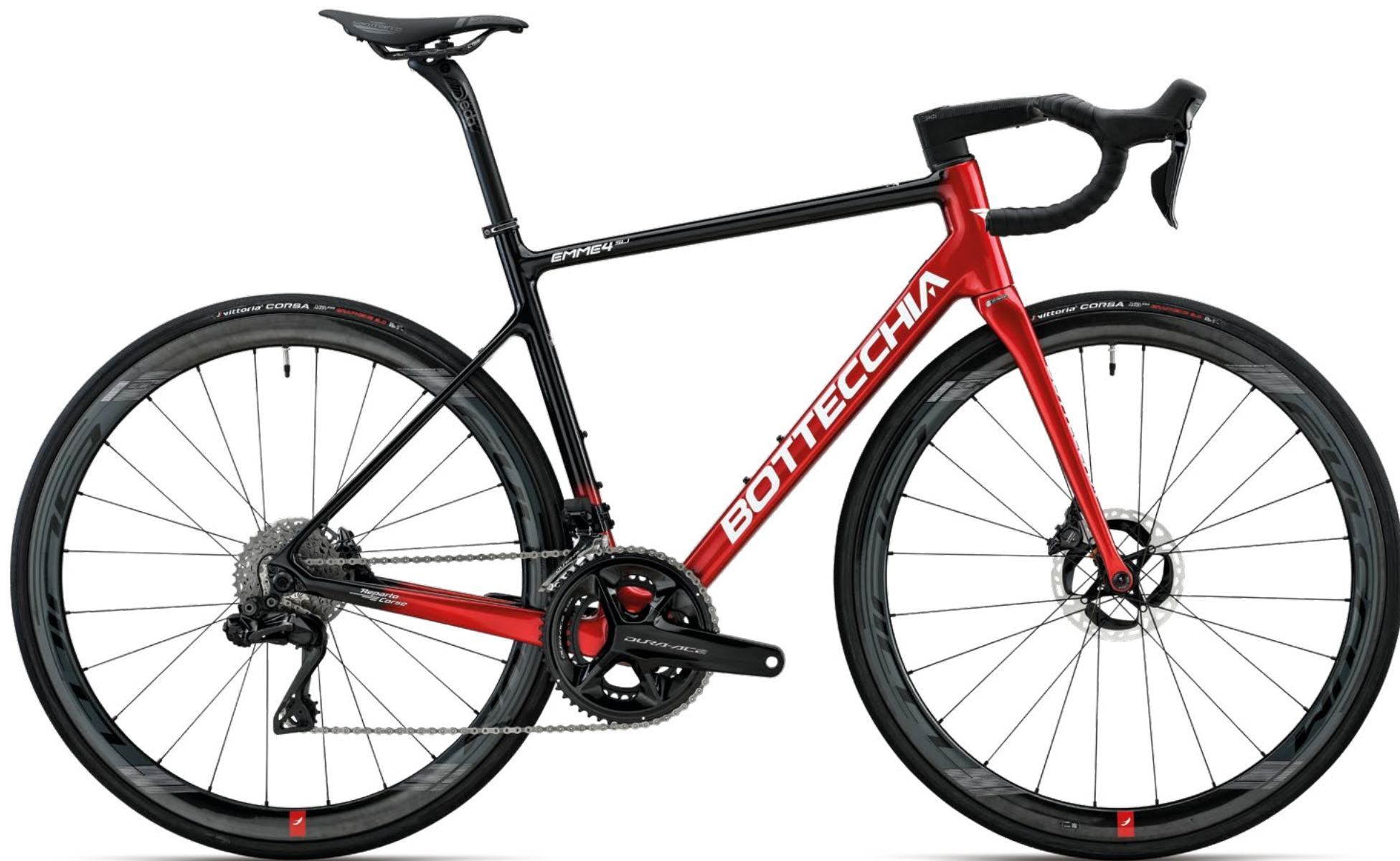
OPZIONE: Piegia integrata Deda Alanera / OPTION: Deda Alanera integrated handlebar

73TD EMME 4 SLI Shimano Dura Ace Di2 24s Disk PESO / WEIGHT 7,270 Kg taglia M / size M COLORE / COLOUR C3 Nero Rosso C3 Black Red