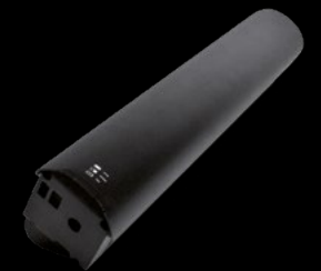
BATTERIA 630 / BATTERY 630