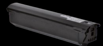
BATTERIA 504 / BATTERY 504