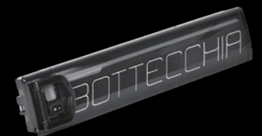
BATTERIA 468 / BATTERY 468