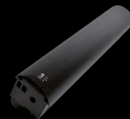
BATTERIA 630 / BATTERY 630