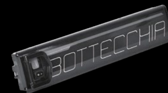
BATTERIA 468 / BATTERY 468