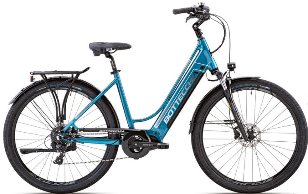
C40 BLU C40 BLUE