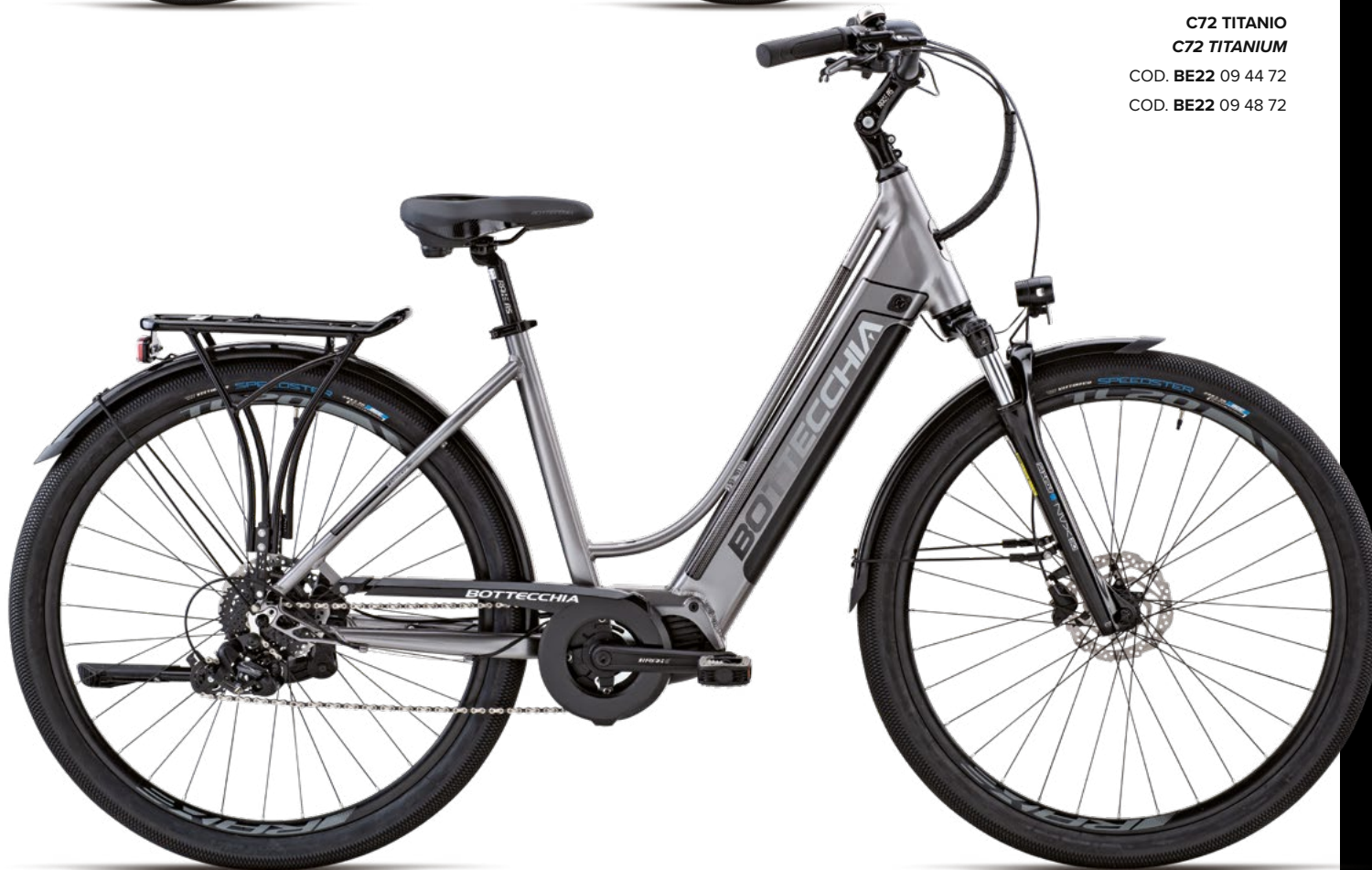
C72 TITANIO C72 TITANIUM