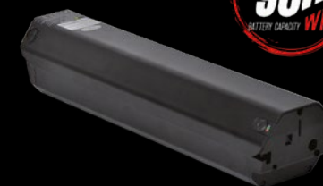
BATTERIA 900 / BATTERY 900