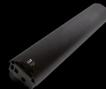
BATTERIA 504 / BATTERY 504