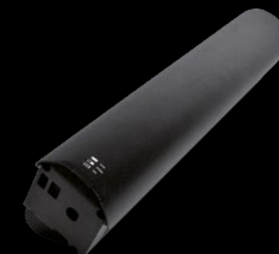
BATTERIA 630 / BATTERY 630