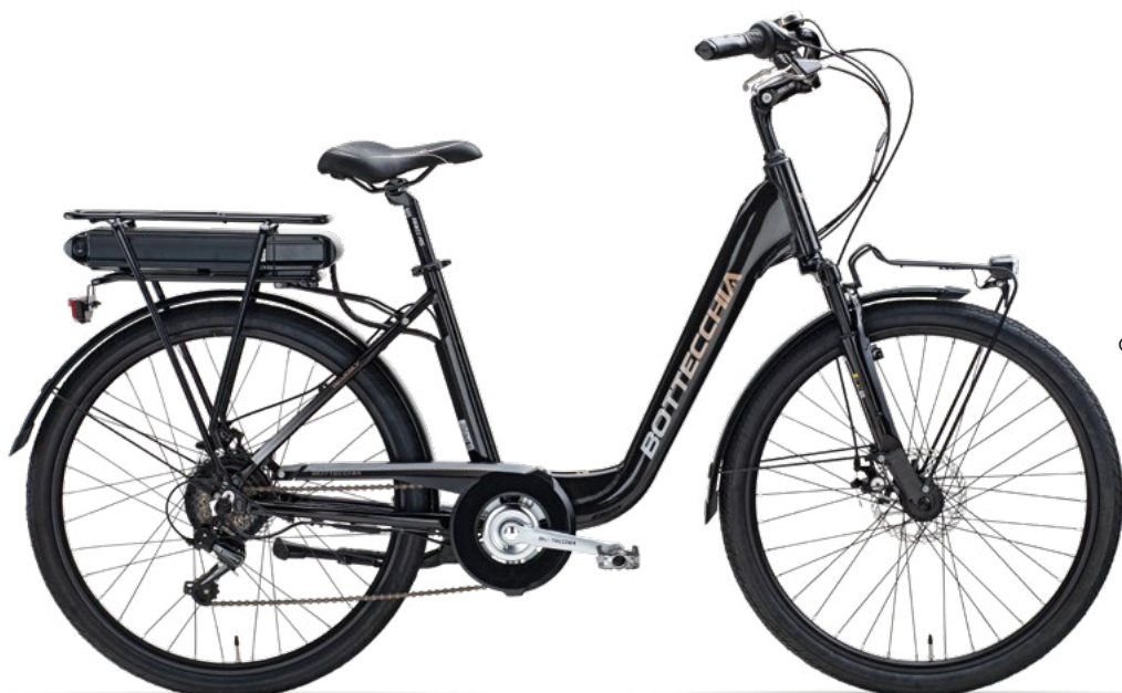
C02 NERO C02 BLACK COD. BE11 09 45 02