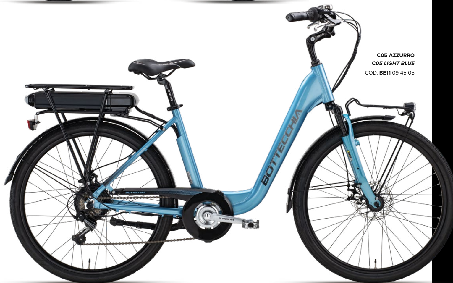
C05 AZZURRO C05 LIGHT BLUE COD. BE11 09 45 05