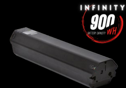
BATTERIA 900 / BATTERY 900