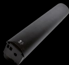
BATTERIA 630 / BATTERY 630

The future has arrived. Infinity is the new 900 Wh battery that ensures unprecedented battery life. Thanks to the latest generation 21700 cells, it is possible to reach a larger capacity without increasing the overall space. This allows you to have the size and weight of a normal battery that perfectly fits to the frame, but more energy available. Infinity allows you to reach a real range of more 200 km, ensuring long-lasting performance and fun.