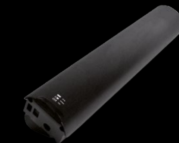
BATTERIA 504 / BATTERY 504