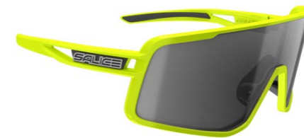
LIME • RW NERO LIME • RW BLACK