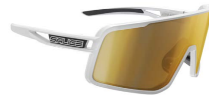
BIANCO • RW ORO WHITE • RW GOLD