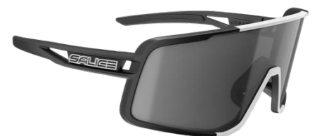
NERO • RW NERO BLACK • RW BLACK