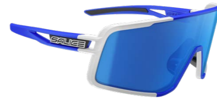
BIANCO • RW BLU WHITE • RW BLUE