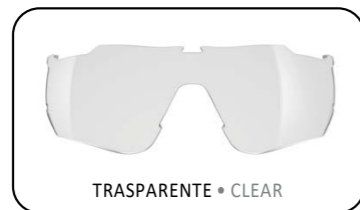
TRASPARENTE • CLEAR