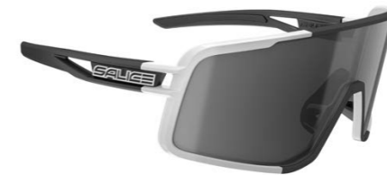
BIANCO • RW NERO WHITE • RW BLACK