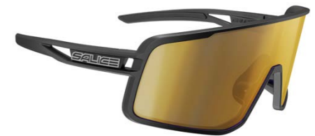
NERO • RW ORO BLACK • RW GOLD