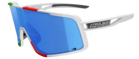
BIANCO • RW BLU WHITE • RW BLUE