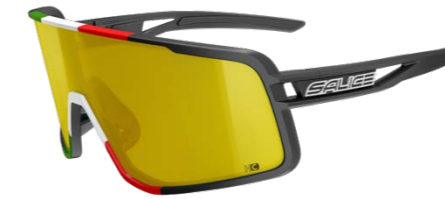
NERO • RW GIALLO BLACK • RW YELLOW