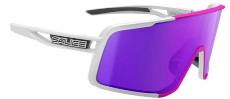
BIANCO • RW VIOLA WHITE • RW VIOLET