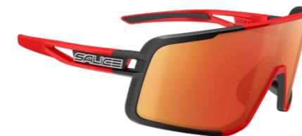
NERO • RW ROSSO BLACK • RW RED