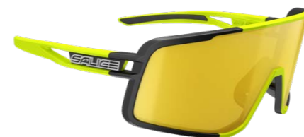
NERO • RW GIALLO BLACK • RW YELLOW