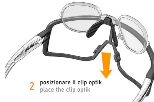
2 posizionare il clip optik place the clip optik