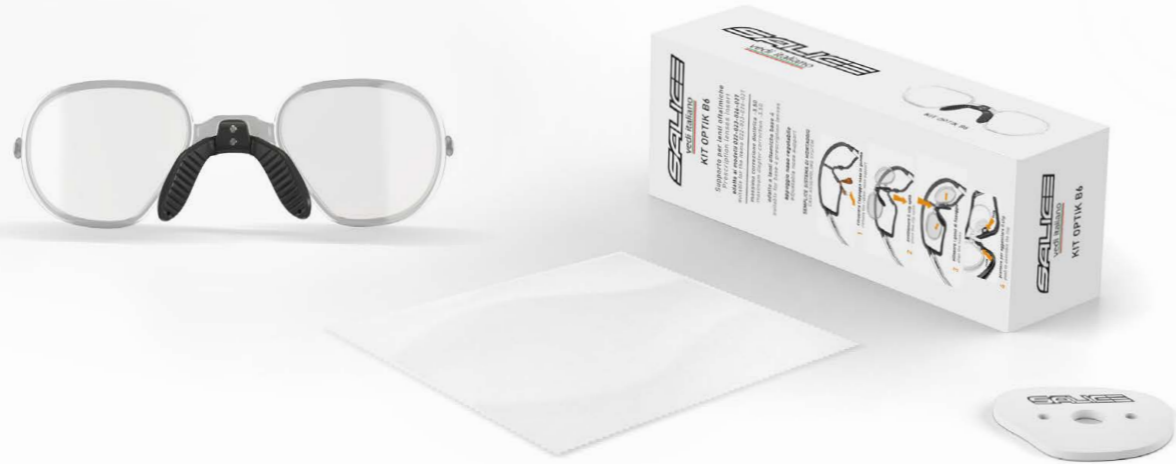
KIT OPTIK B6