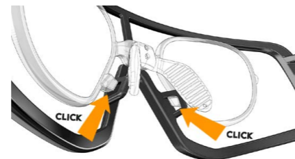
4 premere per agganciare il clip push to assemble the clip