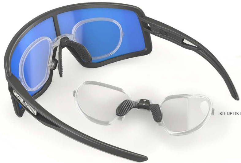
KIT OPTIK B6