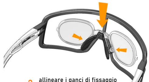
3 allineare i ganci di fissaggio align the hooks