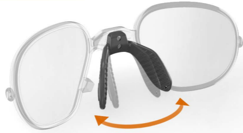
appoggio naso regolabile adjustable nose support